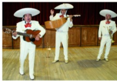
«El Mariachi Veracruz», la chaleur du Mexique a fait fi de la grisaille!

dors, nachos en apéritif, tequila en digestif, les bars décorés aux couleurs du pays... pas de doute, le thème «Viva Mexico» était visible partout, histoire de fêter le 10e anni-