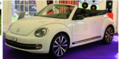
La 21st Century Beetle version Cabriolet... Sa première mondiale fêtée à Los Angeles, la voici en exclusivité à Château-d'Ex!..